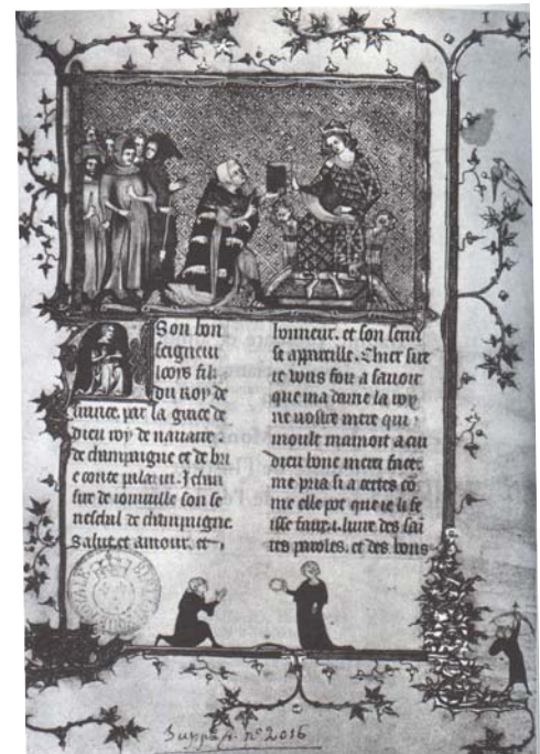
Joinville présentant la Vie de Saint-Louis au roi Louis de Navarre, comte de Champagne. Miniature du XIV ème siècle.