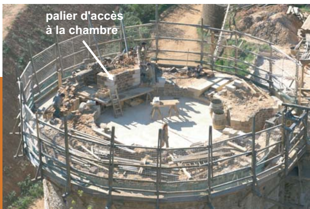
palier d'accès à la chambre