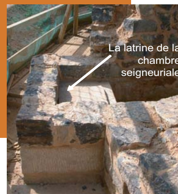
La latrine de la chambre seigneuriale

* encorbellement : maçonnerie en saillie d'un mur.