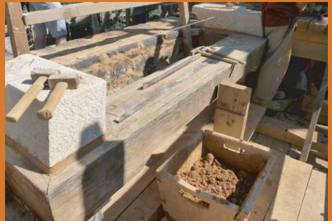
Les montants en calcaire de la hotte ont commencé à être posés

La base de la souche comporte un solin : c'est un joint réalisé avec du mortier qui permet d'assurer l'étanchéité.