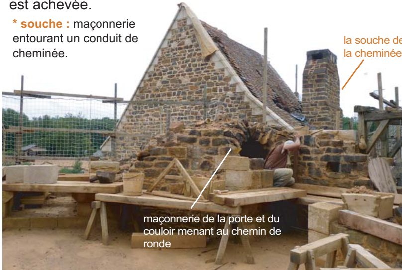
maçonnerie de la porte et du couloir menant au chemin de ronde

* souche : maçonnerie entourant un conduit de cheminée.