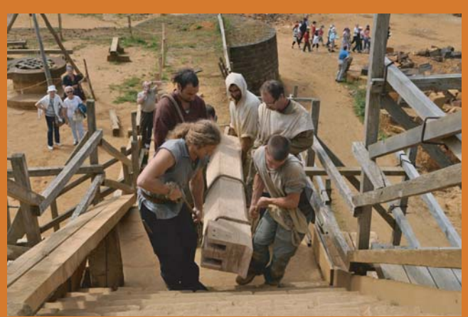
Le linteau de la cheminée est transporté dans la grande salle