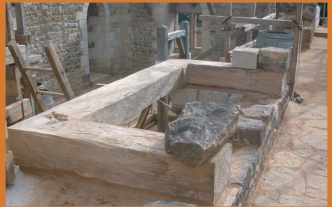
Le linteau est assemblé sur les tablettes