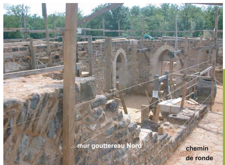
mur gouttereau Nord

* mur de refend : mur porteur séparant deux pièces à l'intérieur d'un bâtiment.