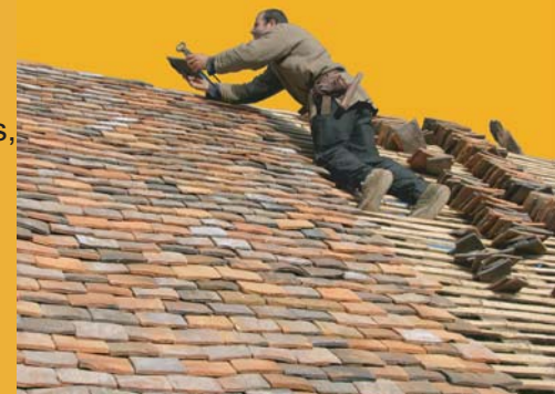
Vue du logis le 4 janvier 2009.