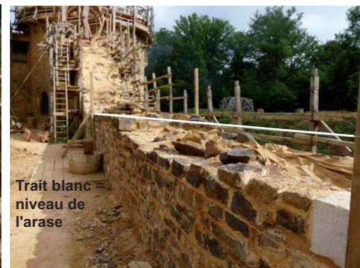
La courtine est