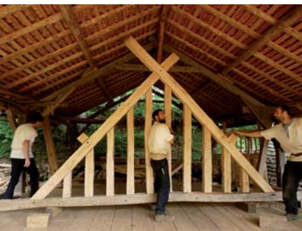
Une des fermes à pans de bois du nouvel atelier pédagogique.