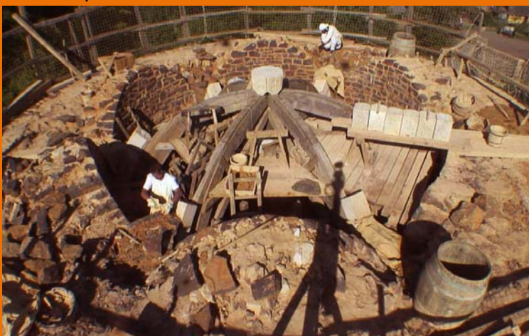
1er août 2011 : tous les arcs formerets sont terminés et la clef est posée au sommet du cintre.