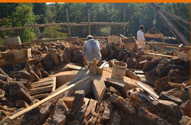
23 septembre 2011 : les dalles de grès sont maçonnées sur les couchis pour former les voûtains.