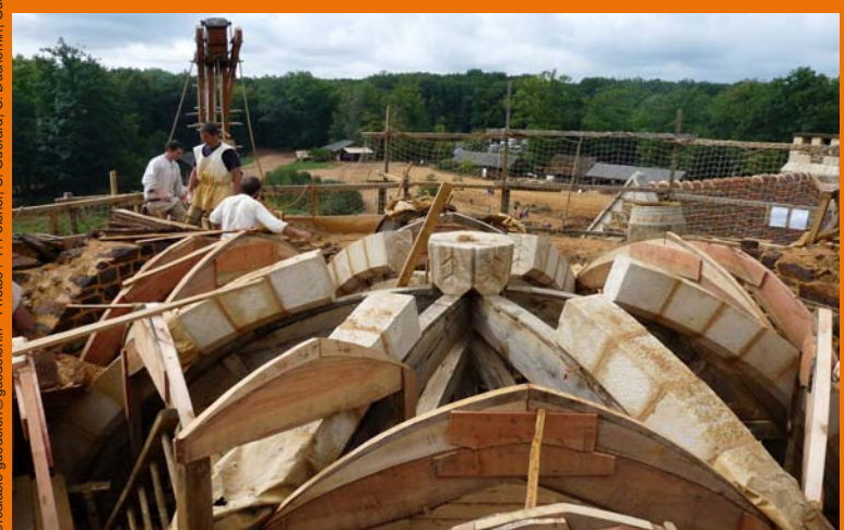
19 août 2011 : la majorité des voussoirs est maçonnée. Seules les contre-clés restent à poser.