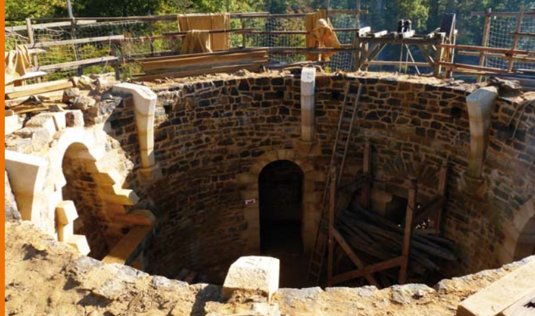
26 août 2010 : le pourtour de la salle est monté et les 6 culots et les sommiers sont implantés.