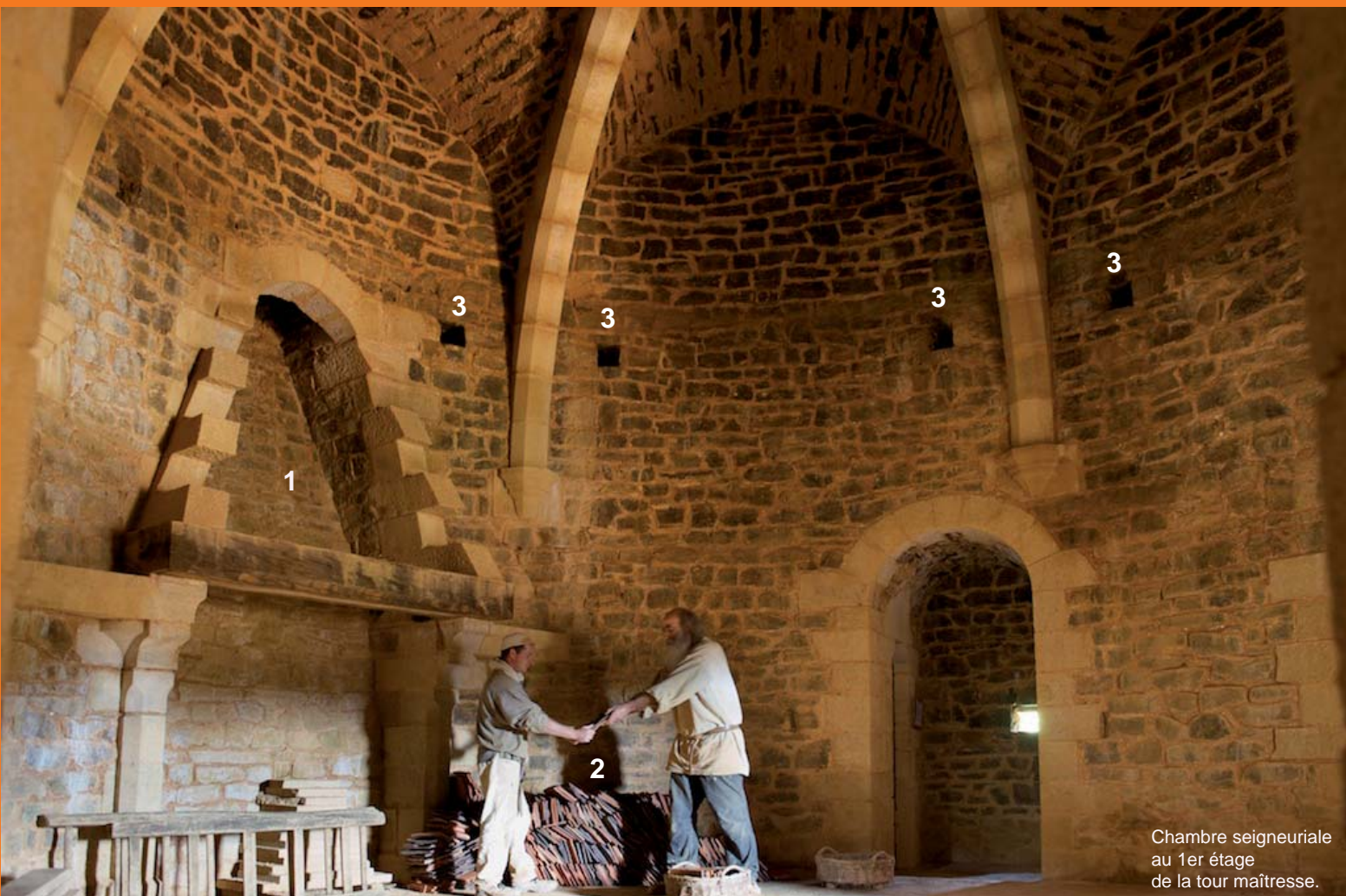
Chambre seigneuriale au 1er étage de la tour maîtresse.

La réalisation de cette pièce voûtée aura nécessité deux saisons de travaux. Nous vous proposons de découvrir ou de redécouvrir les grandes étapes en photos.