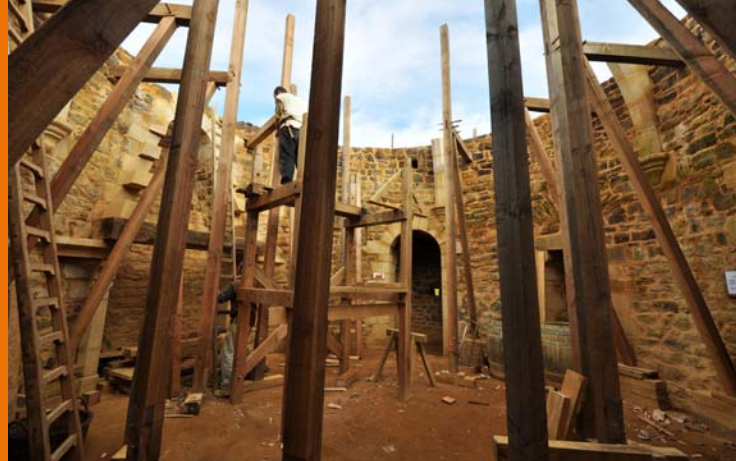
29 août 2010 : les charpentiers installent les écoperches en bois qui soutiendront le cintre.