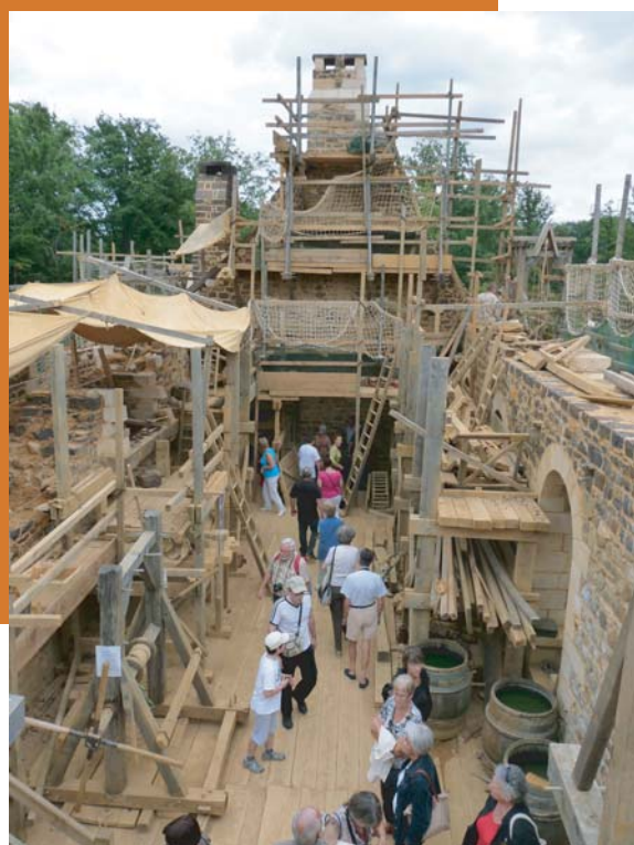
Vue intérieure de la grande salle avec le mur de refend au fond réhaussé de la cheminée de la chambre

- Un plancher provisoire va bientôt être posé par les charpentiers au-dessus de la grande salle. Comme la saison dernière au-dessus de la chambre des invités, ce plancher va permettre aux charpentiers de travailler dans les prochaines semaines au levage des fermes de charpente.