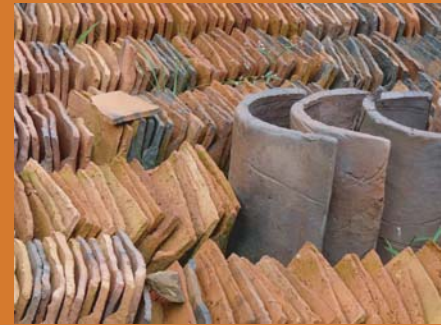
tuiles et faitières cuites