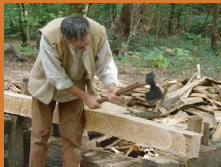
équarrissage d'une pièce de bois

Chaque corps de métier a son rôle à jouer et ses objectifs à tenir afin que le montage des charpentes du logis seigneurial soit une réussite.