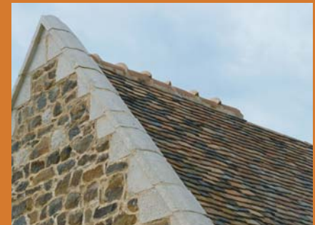
chaperons posés en 2008 sur l'autre pignon