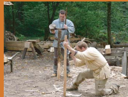
réalisation des lattes

* chaperons : pierres situées sur les arêtes ou le sommet d'un mur permettant d'éviter l'infiltration des eaux de pluie.