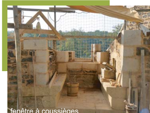
fenêtre à coussièges

Après une pause de quelques jours, les travaux ont repris dans la chambre seigneuriale, au 1 er étage de la tour maîtresse.