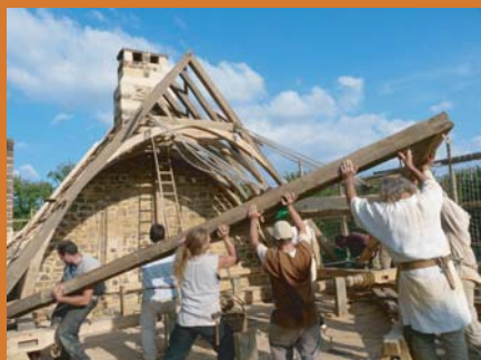
levage d'une ferme de charpente