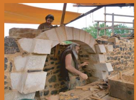
arc de décharge de la cheminée