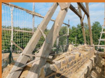
maçonnerie du mur pignon Ouest

Les bûcherons ont équarri environ 40 m 3 de chêne, soit plus d'une centaine de pièces de bois qui ont été livrées chez les charpentiers. Ils débitent les 2 000 lattes de chêne nécessaires à la couverture des deux travées de charpente. Le bois est fendu "en suivant la ligne du bois" à l'aide du départoire et du maillet . Les bûcherons terminent la saison en taillant les pièces de bois nécessaires au montage du futur atelier de géométrie qui sera ouvert aux groupes d'enfants pour 2010.