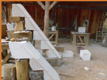
chaperons en attente de pose