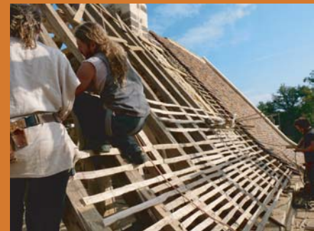
pose du lattis