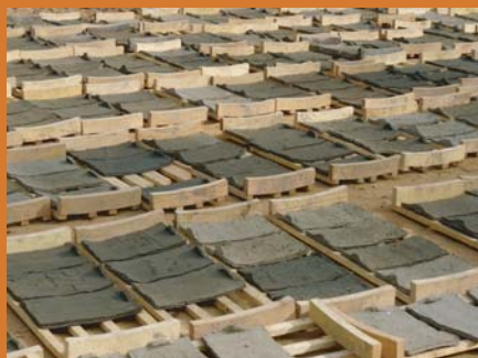
tuiles au séchage avant cuisson