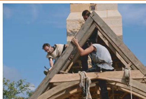
Les charpentiers procèdent aux ultimes assemblages.