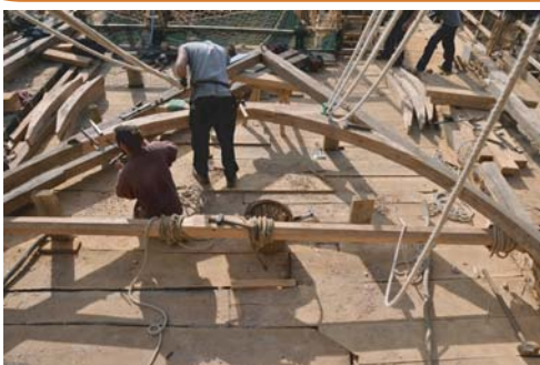
Les charpentiers assemblent les éléments d'une ferme avant le levage.