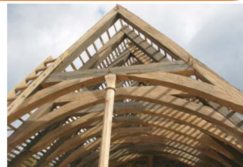
Le lattis est cloué ; les tuiles vont être posées.