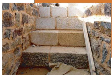
Les 1 ères marches de l'escalier rampant

Ils achèvent la latrine de la chambre seigneuriale et les deux postes de maçonnerie vont se rejoindre prochainement au niveau de la cheminée. Cette jonction marquera la fin de l'arase intérieure à 2 m au dessus du sol.