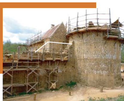
Vue de la cortine Est au 26 avril 2010.