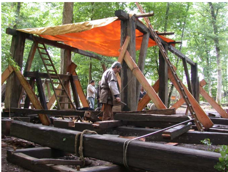
Les deux pans de l'atelier viennent d'être levés

Dès que l'on quittait les abords du château et que l'on s'enfonçait dans la forêt, on assistait à un autre chantier : celui des bûcherons qui assemblaient avec l'aide de bâtisseurs les pans de bois de leur futur atelier.