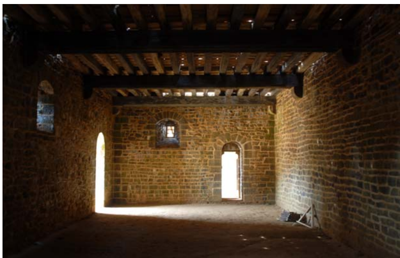
Vue intérieure du cellier.

Alors que nous travaillons manuellement et que nombreux de nos visiteurs s'inquiètent sur la durée de notre projet, nous n'avons pas vu passer cette année 2007. Dès la reprise le 12 mars, nous n'avons qu'un objectif : terminer le rez-de-chaussée du logis seigneurial, avec la couverture de la cuisine et du cellier. Le foyer de la cheminée de la cuisine est pourvu d'un four à pain qui a été testé pour la première fois le 13 août : une cuisson de miches de pain qui se sont avérées fort succulentes.