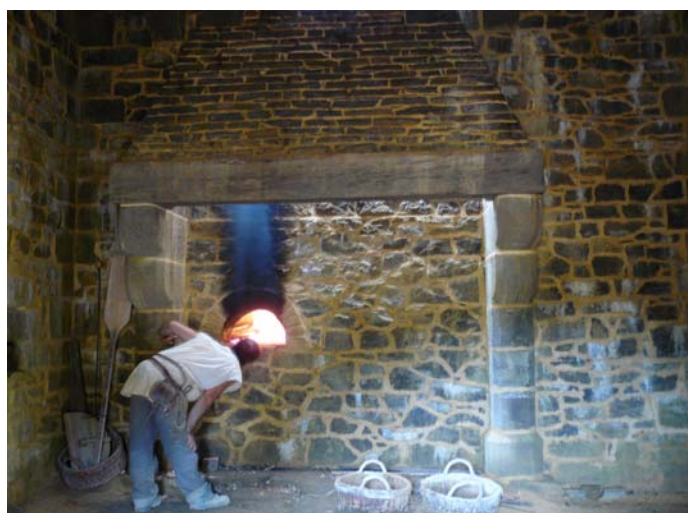
Cuisson du pain dans le four