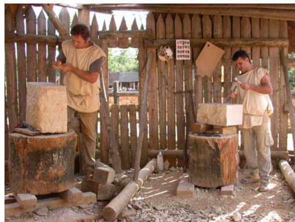
Des tailleurs de pierre "de passage"

La fenêtre géminée au pied du logis, éclairée par des bougies