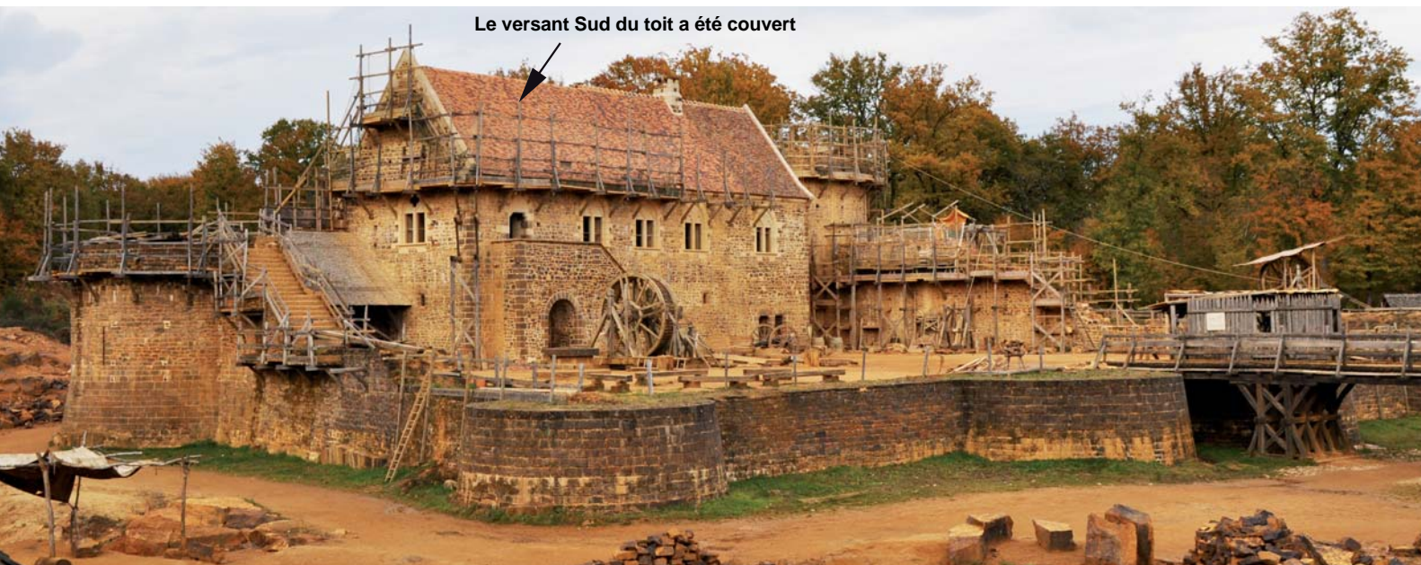
Le versant Sud du toit a été couvert