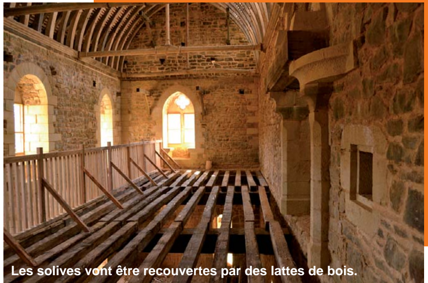
Les solives vont être recouvertes par des lattes de bois.

Les bûcherons et charpentiers vont tailler des lattes de bois en chêne qui seront posées sur les solives. Puis, les maçons vont couler un mortier armé de paille qui sera par la suite recouvert de carreaux de pavement. Une partie du plancher provisoire a été conservée et une rambarde installée afin que les visiteurs puissent être au coeur des travaux de cette saison 2011.