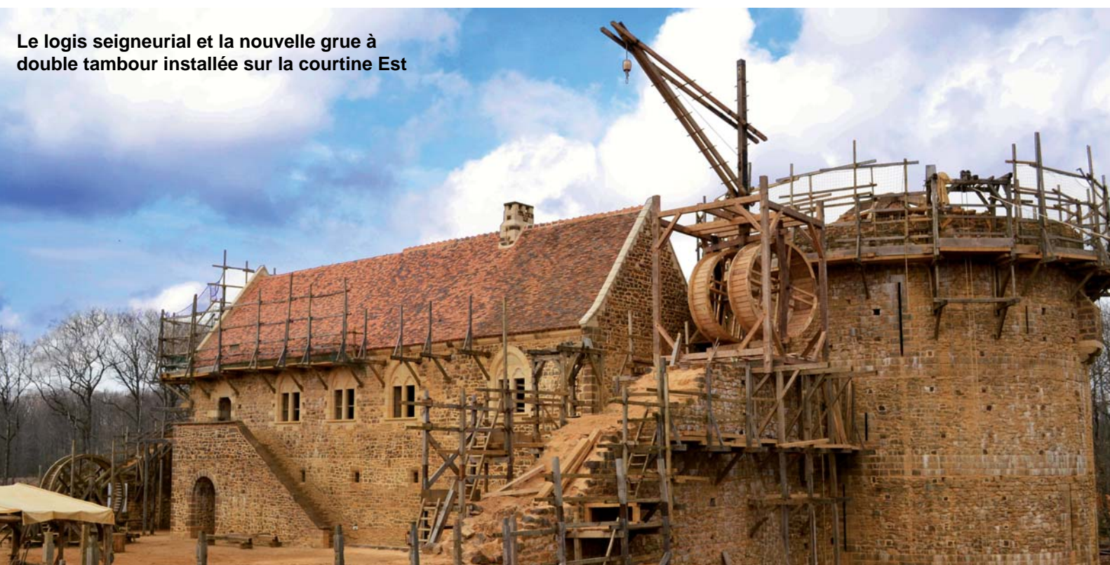
Le logis seigneurial et la nouvelle grue à double tambour installée sur la courtine Est