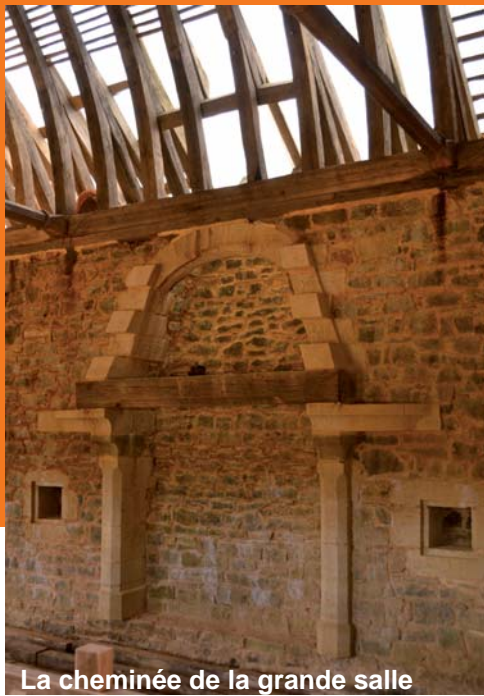
La cheminée de la grande salle