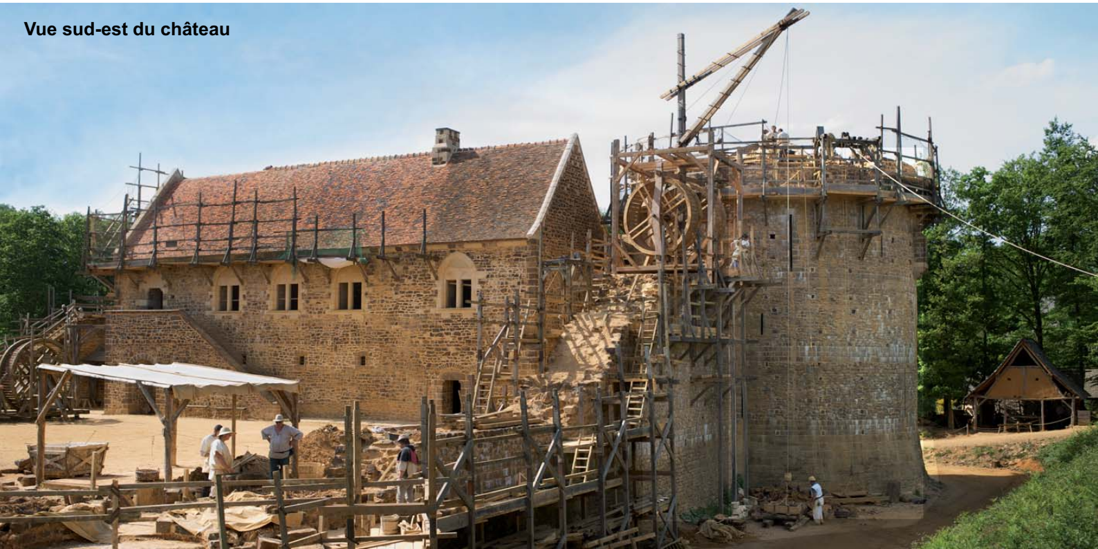
Vue sud-est du château