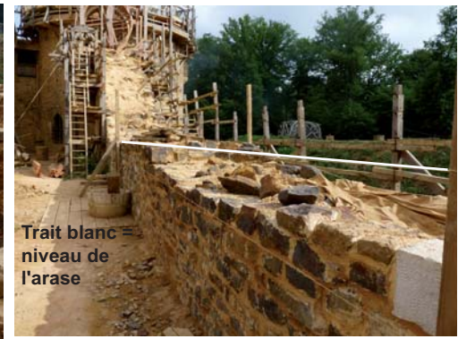
La courtine est