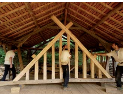
Une des fermes à pans de bois du nouvel atelier pédagogique.