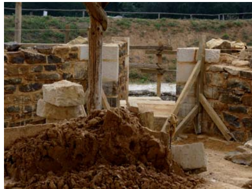
Porte d'entrée de la tour d'angle