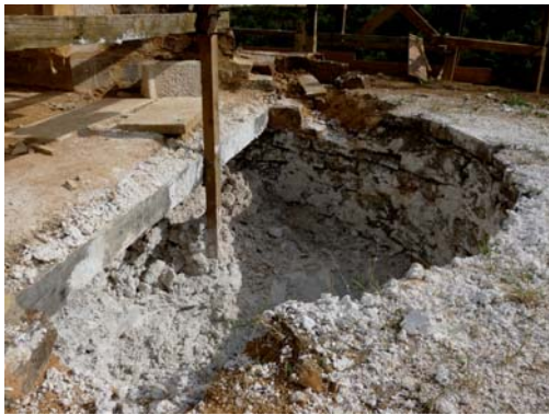
L'intérieur de la tour d'angle est rempli de chaux