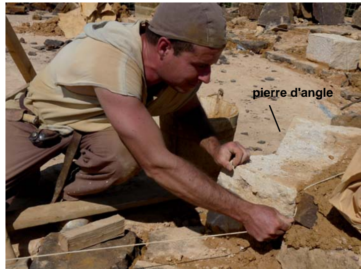
Pose et réglage d'une pierre d'angle de la salle octogonale