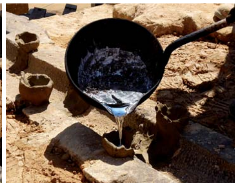
Le plomb est coulé dans un creuset en argile