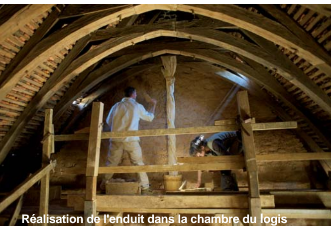
Réalisation de l'enduit dans la chambre du logis