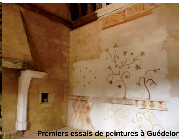
Premiers essais de peintures à Guédelon