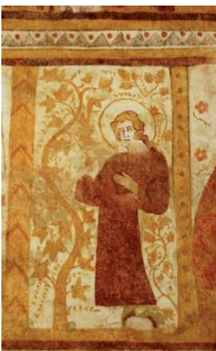
Eglise de Moutiers (89) www.peinturesmurales.com