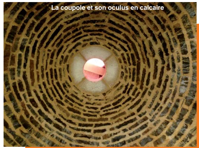
La coupole et son oculus en calcaire

Une fois l'anneau fermé, les pierres se bloquent entre elles et tout risque de chute de dalles est écarté. Les maçons réutilisent les perches pour chaque niveau circulaire.