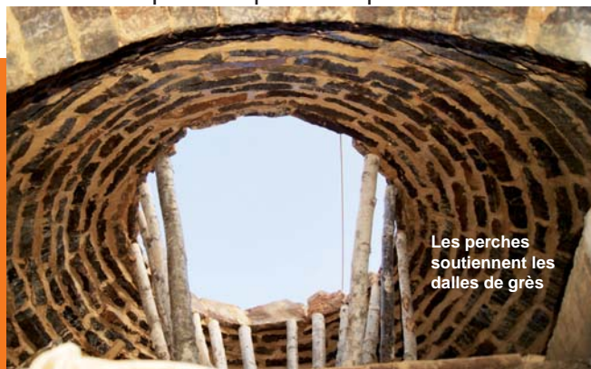
Les perches soutiennent les dalles de grès

La coupole presque achevée, il faut encore ➤ poser l'oculus* en calcaire.