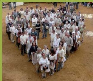
Un cœur de bâtisseurs !