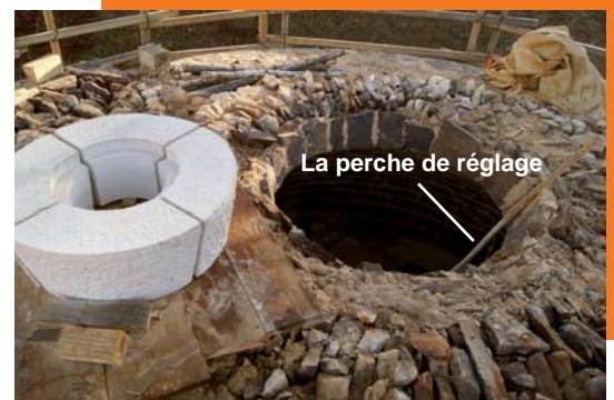
La perche de réglage

Désigne toute ouverture circulaire réalisée dans un mur ou un couvrement (voûte, plate-bande...)