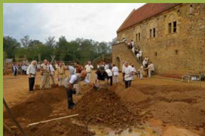
La grande chaîne d'approvisionnement en terre