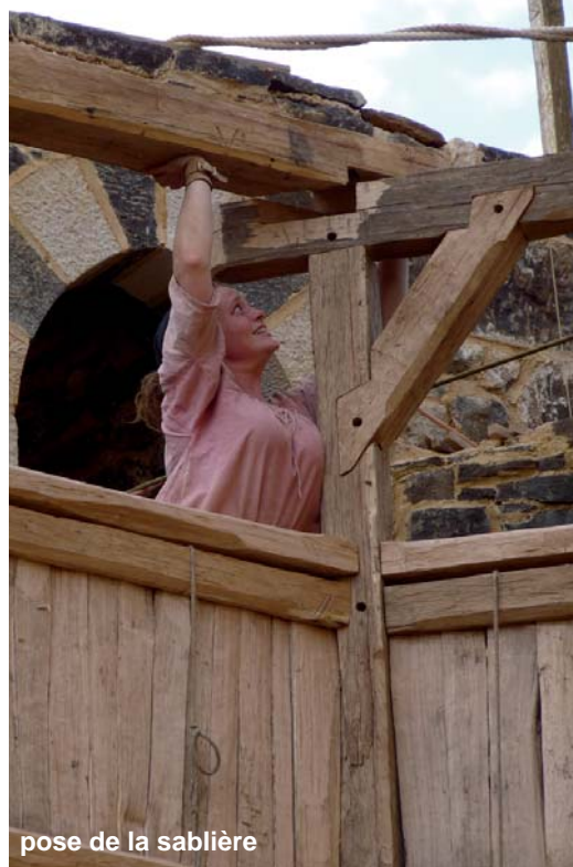
pose de la sablière