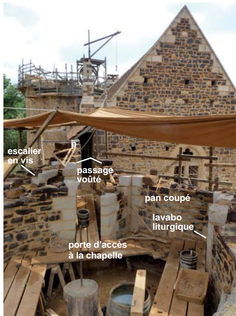
photo de la chapelle au 25 juin. Depuis, plusieurs ouvrages sont terminés ou ont bien progressé mais les échafaudages intérieurs ne permettent plus, aujourd'hui, d'avoir cette vue d'ensemble.

Depuis notre dernier numéro, les travaux ont bien avancé sur la chapelle. Nous terminons l'étape 1 (voir Château en vue ! N°34) et réalisons l'étape 2 avec l'élévation des maçonneries de 2 à 4 mètres au-dessus du sol de la salle. Le lavabo liturgique , incrusté dans une niche en trilobe à colonnettes, est posé.