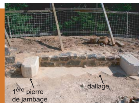
cheminée de la chambre seigneuriale