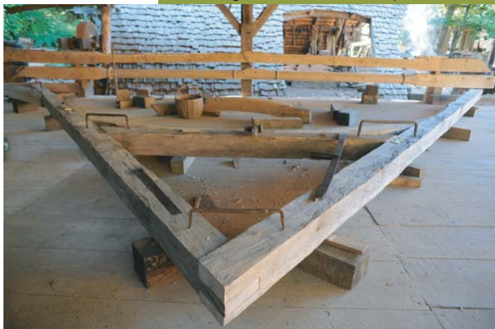
Assemblage d'une ferme de charpente

Comme annoncé dans un précédent numéro, l'autre moment fort de la saison 2008 se passe chez les charpentiers avec la réalisation des premières charpentes du logis seigneurial. Cette charpente est de type "chevrons formant fermes". C'est une charpente type XIII ème inspirée notamment du parloir bourgeois de Chartres. La charpente est réalisée en chêne 100 % et comporte 47 fermes au total ( ferme désigne globalement l'assemblage triangulaire d'une charpente) L'objectif de cette saison étant de tailler et d'assembler les 2 fermes principales et les 7 fermes secondaires de la chambre du logis.