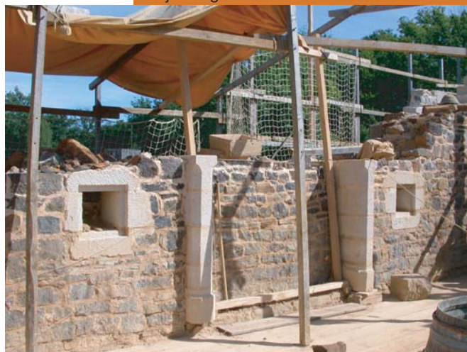
les jambages de la cheminée et les niches