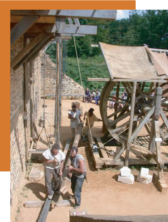
Transport d'un chevron par le grand degré (grand escalier extérieur)

Les éléments séparés : chevrons, entrails, faux-entrails ont été montés par le grand degré au niveau du plancher de la aula .