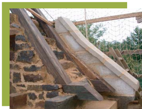
chaperons de la rive de toit