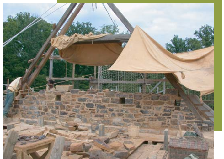
Maçonnerie du mur pignon (les trous apparents dans la maçonnerie sont des trous de boulins qui permettront d'ancrer les échafaudages)

N'hésitez pas à venir assister à ce moment unique !