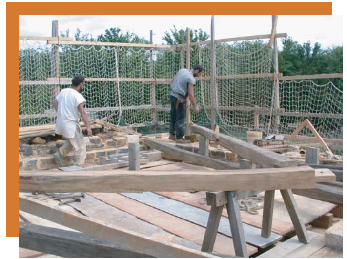
Les éléments de la charpente sont assemblés avant d'être levés à la verticale

Le triangle des fermes permet de guider les maçons dans l'élévation du mur pignon.