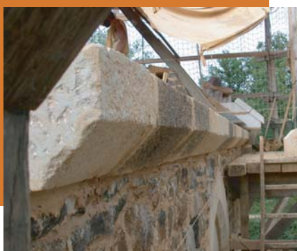
pierres de corniche

Côté chambre : Les travaux de ce mois d'août ont porté principalement sur l'élévation du mur pignon (à l'Est) afin d'assurer la hauteur nécessaire à la mise en place des fermes de charpente. Les premières pierres de corniche ont été maçonnées en surplomb de la façade sud. Les premiers chaperons en calcaire de la rive de toit ont été posés.