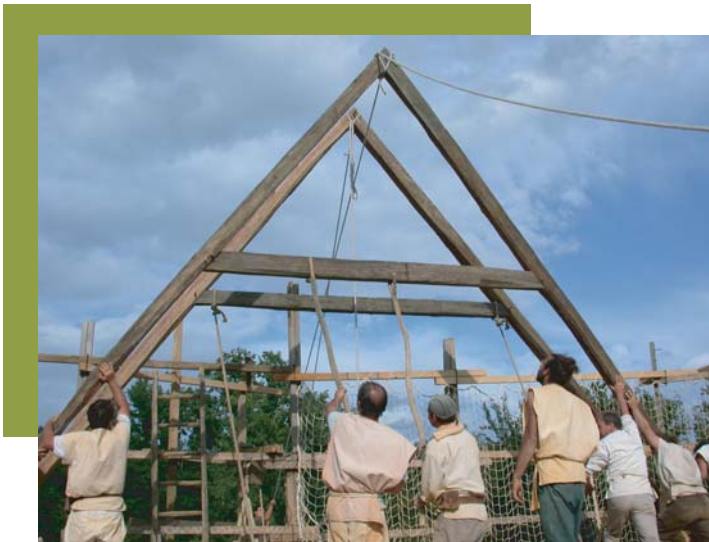
La 2 ème ferme est levée

Le triangle des fermes permet de guider les maçons dans l'élévation du mur pignon.