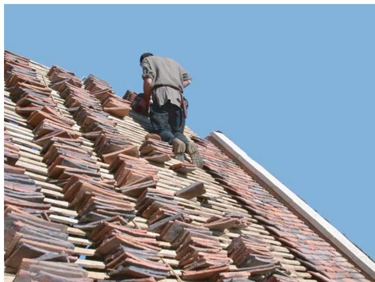
Pose des tuiles