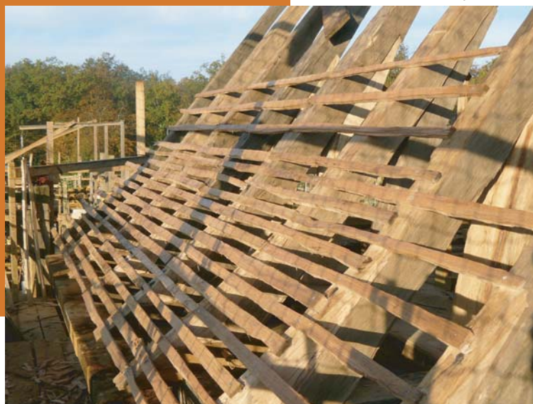
Le lattis en cours de pose