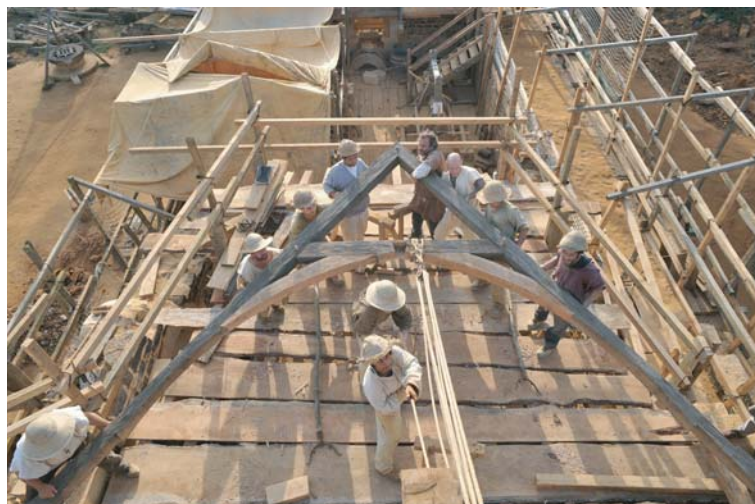
Levage d'une ferme de charpente

Tout est allé très vite en cette fin de saison ! Les 9 fermes restantes ont été transportées, assemblées et levées en 6 jours. Aussitôt, les charpentiers se sont attaqués à poser le lattis (= petites lattes de bois destinées à recevoir les tuiles) sur les deux pentes du toit. Le lattis en chêne avait été fendu au préalable par les bûcherons. Pas moins de 900 lattes de 4 pieds chacune (= 1,20 m) ont été réalisées.