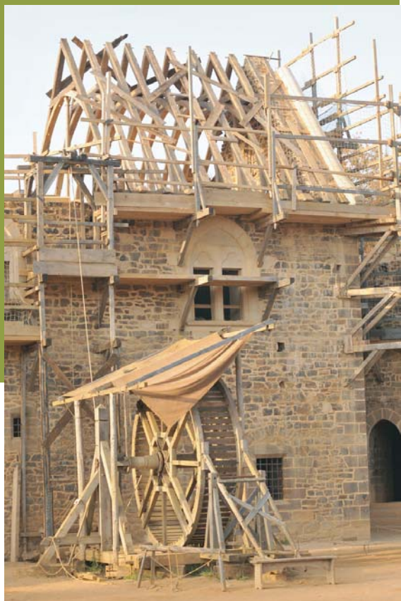
Les 9 fermes sont en place au dessus de la chambre

Puis, une équipe s'est attachée à poser les 6 000 tuiles afin d'assurer l'étanchéité de cette salle avant l'hiver. A noter, que toutes ces tuiles ont du être transportées dans un premier temps de la forêt au chantier avec les chevaux, puis elles ont été hissées au niveau du chemin de ronde à l'aide de la cage à écureuil.