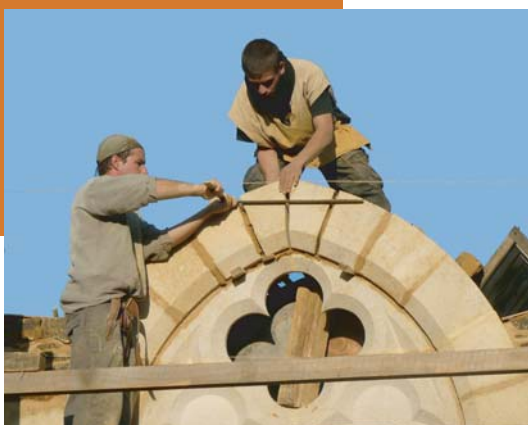
pose de la clef sur la fenêtre à quadrilobe.

Dans la aula : Les 3 dernières fenêtres géminées en calcaire ont été posées. Celle du pignon ouest se singularise des 4 autres par son quadrilobe percé dans le tympan.