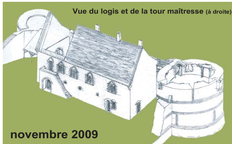
Vue du logis et de la tour maîtresse (à droite)