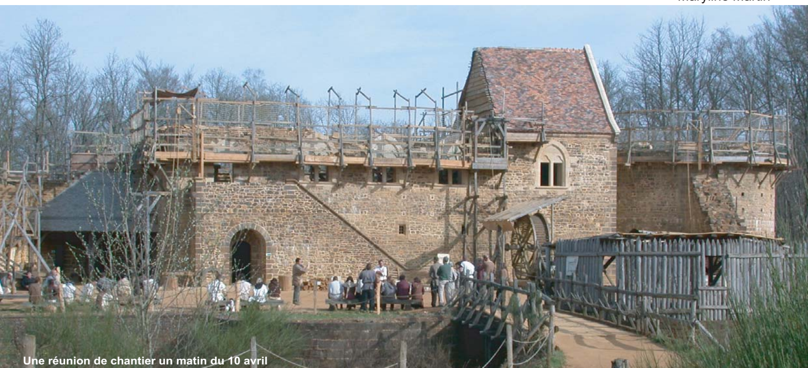
Une réunion de chantier un matin du 10 avril