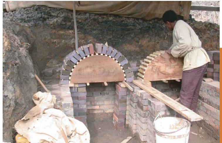
Construction du nouveau four à tuiles

Depuis 2008, la tuilerie est passée de la phase d'expérimentation à la phase de production. Les dernières cuissons ont été concluantes (cf. Château en vue ! N°6 .) Nous allons donc construire un nouveau four plus productif afin de cuire les 20 000 tuiles nécessaires cette saison. Merci aux bâtisseurs "temporaires" et aux jeunes de l'Institut Bager qui nous aident dans cette réalisation.