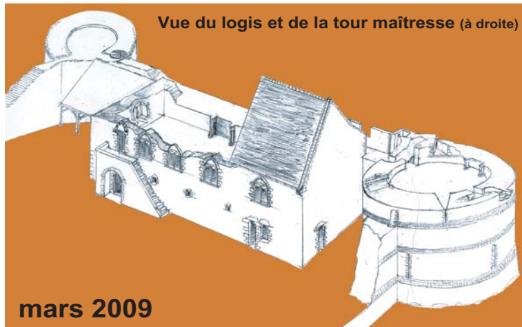
Vue du logis et de la tour maîtresse (à droite)

Les travaux de cette saison 2009 porteront essentiellement sur le logis seigneurial avec l'achèvement des maçonneries du 1 er étage, l'assemblage des fermes de charpente et la couverture du toit. En parallèle, une autre équipe s'attaquera à élever le 1 er étage de la tour maîtresse.