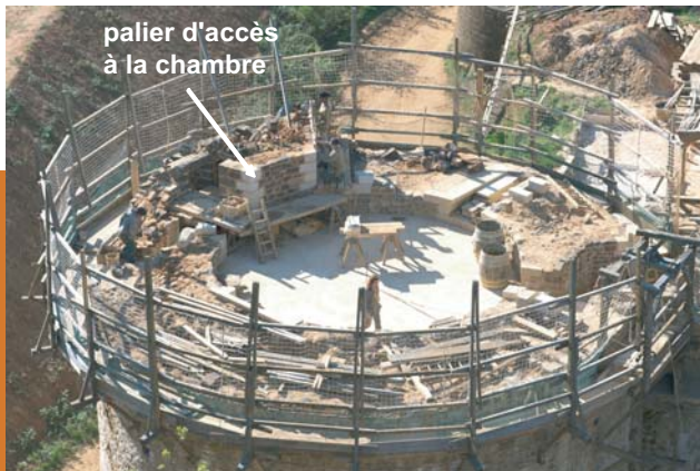
palier d'accès à la chambre