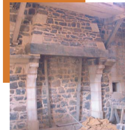
Cheminée de la chambre des invités