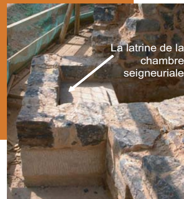
La latrine de la chambre seigneuriale