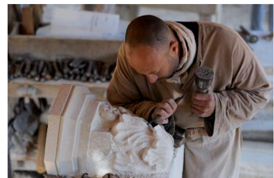
un culot de la future voûte en cours de taille

Les bûcherons et les charpentiers réalisent un pont provisoire qui va surplomber les profonds fossés et qui permettra d'accéder à la cour du château par la courtine est. Ce pont est indispensable lorsque les travaux sur la courtine sud auront commencé dans quelques saisons.