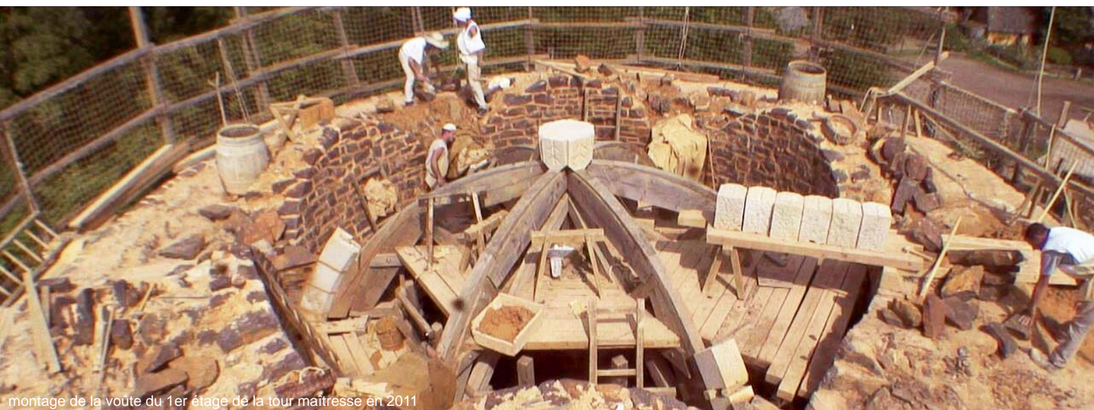
montage de la voûte du 1er étage de la tour maîtresse en 2011