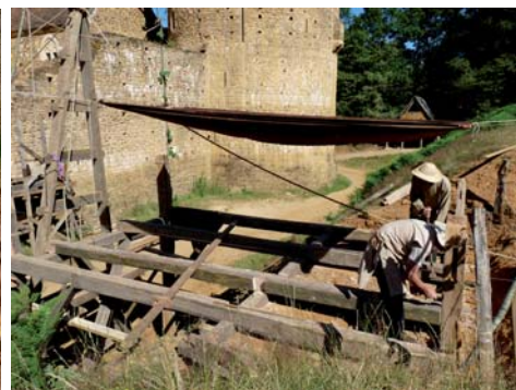
les premières longrines sont posées