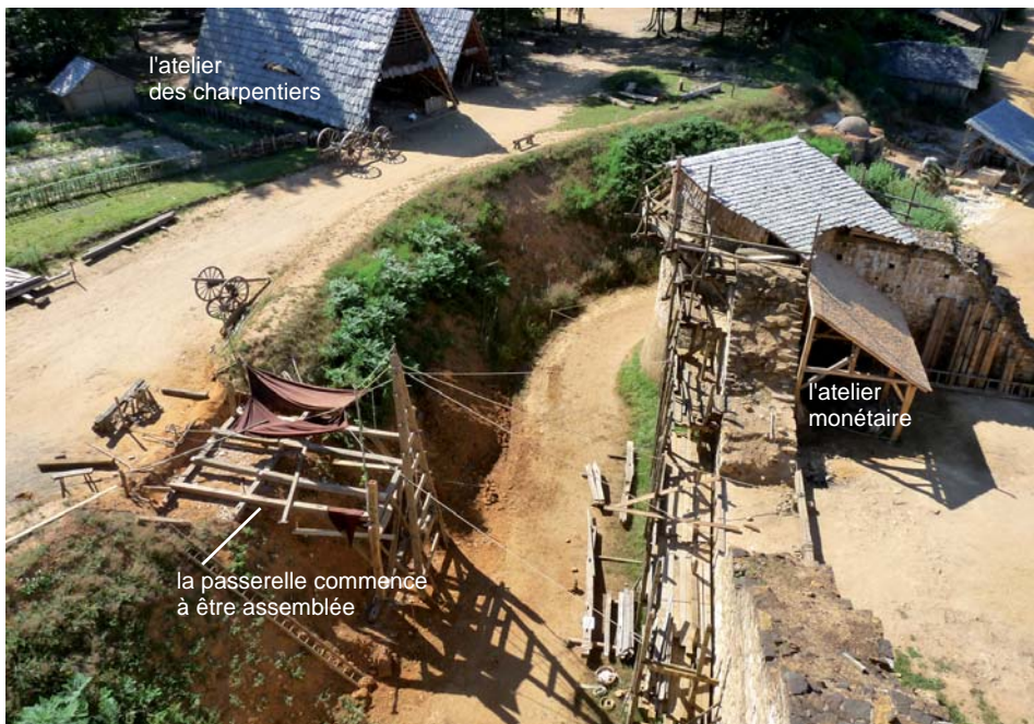
l'atelier des charpentiers