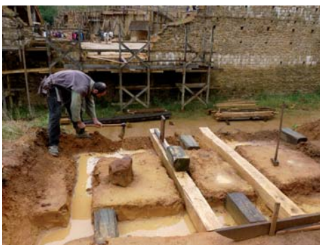
des pièces de bois ancrées dans le sol constituent les fondations