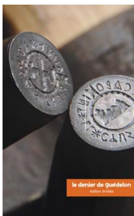
le denier de guédelon