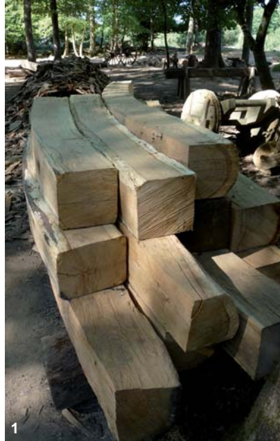
1 : sablères courbes