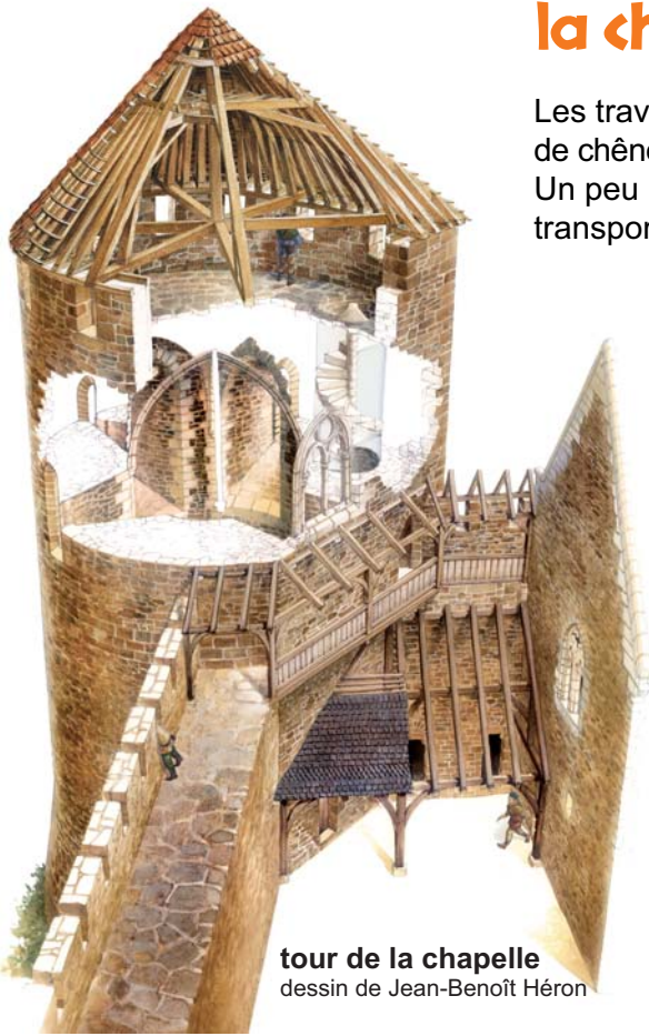
tour de la chapelle dessin de Jean-Benoît Héron

Les travaux d'équarrissage, de taille et d'assemblage des nombreuses pièces de chêne composant la future charpente de la tour de la chapelle se poursuivent. Un peu plus de la moitié du travail est déjà réalisé. Cette charpente sera transportée et assemblée au sommet de la tour au printemps 2018 .