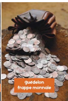
guédelon frappe monnaie