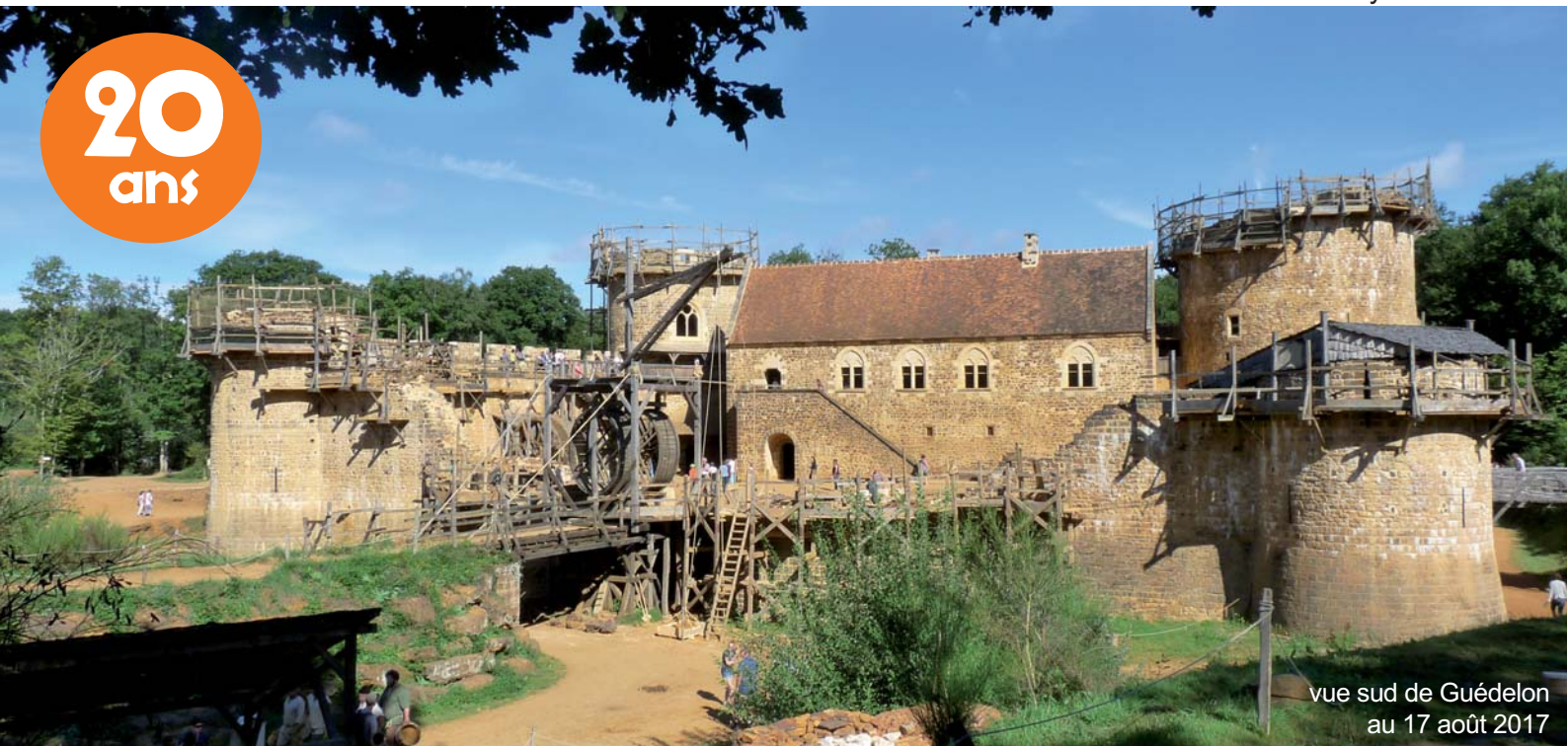
vue sud de Guédelon au 17 août 2017