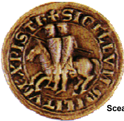
Sceau des Templiers

Les sceaux étaient l'empreinte laissée par pression d'une matière dure sur une matière molle. Par exemple, par le métal sur l'argile dans l'Antiquité ou la cire au Moyen Age.