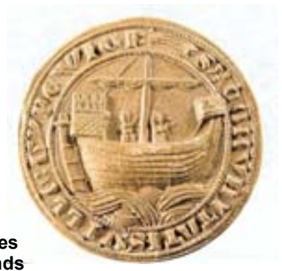
Sceau des Marchands parisiens