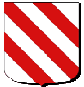
Blason de Lancelot Chevalier de la table ronde D'argent aux trois bandes de gueules

- Ne jamais mettre couleur sur couleur, ou métal sur métal ( donc pas de lion bleu sur fond rouge, par exemple, mais sur fond or ou argent.