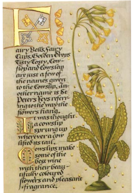
Manuscrit du XVème siècle.

Certains mots du Moyen age ont disparu ou ont changé de sens. Essaye de retrouver leur sens aujourd'hui en les reliant par une flèche.