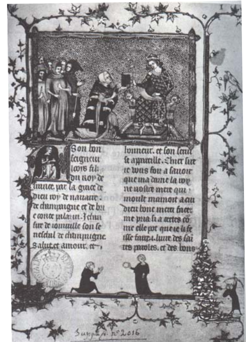
Joinville présentant la Vie de Saint-Louis au roi Louis de Navarre, comte de Champagne. Miniature du XIV ème siècle.